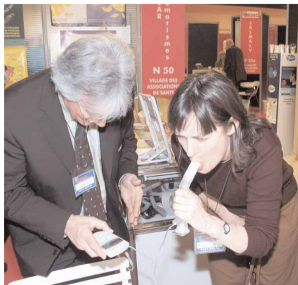
Déjà en 2004, les visiteurs du Medec étaient invités à mesurer leur souffle au village des associations de santé

La réalisation de ce journal a pu être possible grâce au soutien des laboratoires AstraZeneca, Boehringer Ingelheim, GlaxoSmithKline et Pfizer.