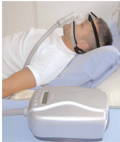
Un appareillage de Pression Positive Continue ou PPC

plus approfondie après un enregistrement de la saturation nocturne (oxymétrie). Il sera confirmé par une polygraphie ou une polysomnographie, examen qui consiste à enregistrer la structure du sommeil, les mouvements respiratoires, les flux aériens, la saturation en oxygène. Cet examen peut être réalisé en ambulatoire, dans tous les cas par un pneumologue formé à cette technique.