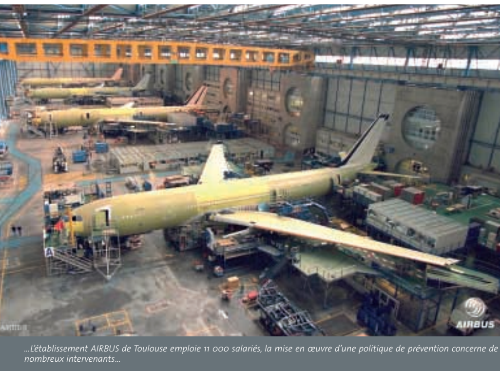
...L’établissement AIRBUS de Toulouse emploie 11 000 salariés, la mise en œuvre d’une politique de prévention concerne de nombreux intervenants...